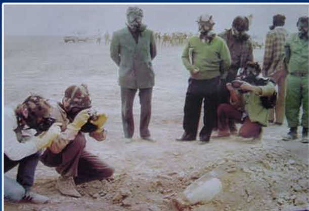
تیم بازرسان سازمان ملل در جیبه جنوبی ۱۳۶۲